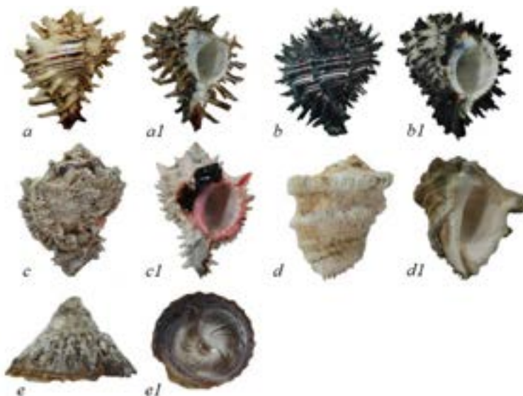
Figure 3. Species of the Gastropoda Class that obtained the highest capture volumes and generate the highest economic income in Costa Grande, Guerrero. a-a1) Hexaplex princeps ; b-b1) Hexaplex radix ; c-c1) Hexaplex regius ; d-d1) Neorapana muricata ; e-e1) Trochita trochiformis .