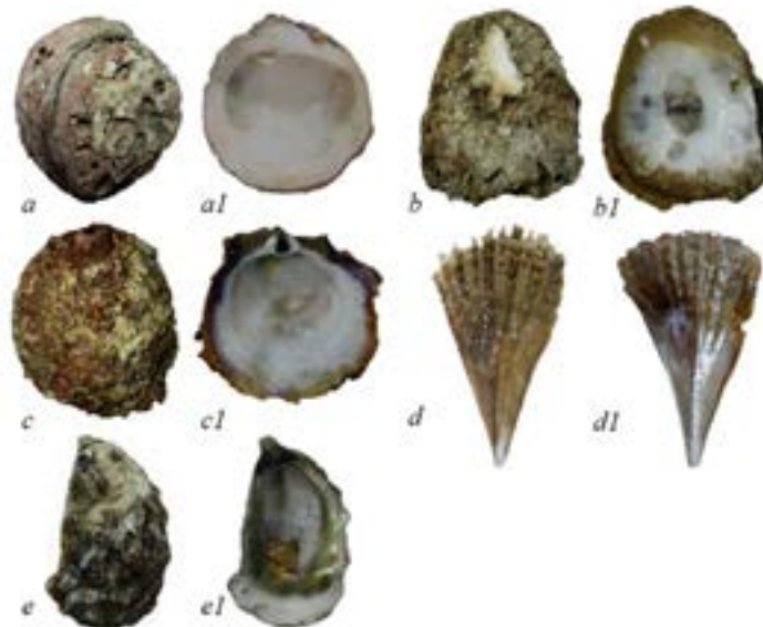
Figure 2. Species of the Bivalvia Class that obtained the highest capture volumes and generated the highest economic income in Costa Grande, Guerrero. a-a1) Chama buddiana ; b-b1) Hyotissa hyotis ; c-c1) Spondylus limbatus ; d-d1) Pinna rugosa ; e-e1) Striostrea prismatica .